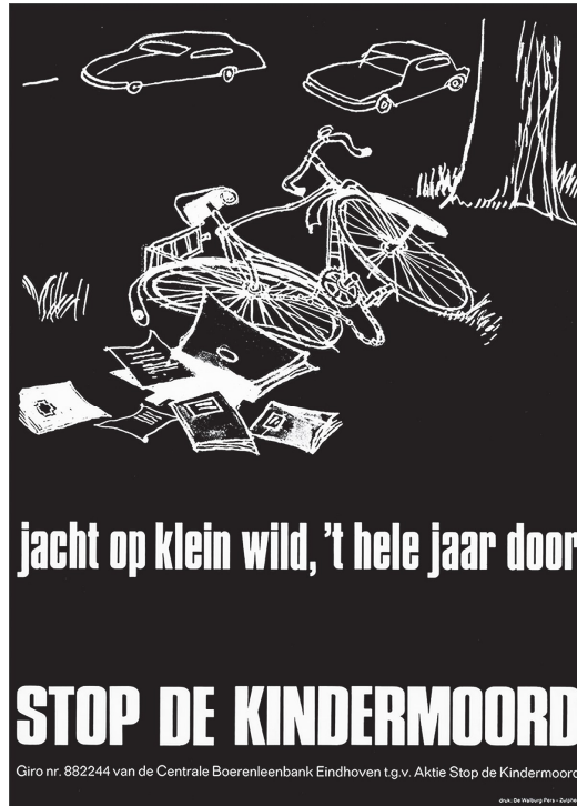
Affiche voor Stop de Kindermoord, ontworpen door Charles Boost 1973

Boze ouders trokken de straat op en blokkeerden wegen. Spontane acties groeiden uit tot een georganiseerde groepering. Bij elk ongeluk met een fietser gingen vertegenwoordigers naar de plek van het ongeluk om de oorzaak te analyseren. Dit had een sneeuwbal effect. Stop de Kindermoord verwelkomde